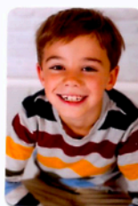
Franz Xaver Rettensteiner